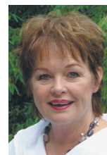
Ghita Nørby Protector for Hospice Forum Danmark

Hospice Forum Danmark er en paraplyorganisation for 15 hospiceforeninger over hele landet, som på frivillig, privat basis arbejder for at udbrede kendskabet til hospice med sigte på at få etableret så mange hospice-pladser, at der kan tales om et reelt frit valg til at kunne tilbringe den allersidste levetid på et hospice.