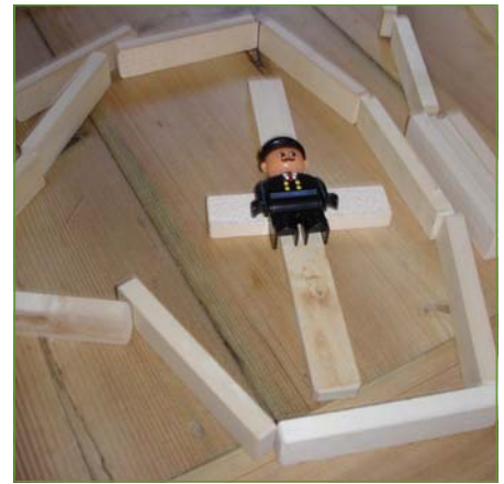
5-årig drengs sorgbearbejdning

Jeg går ned på stuen for at tænde stearinlys og se til afdøde. Da jeg kommer ud på gangen, er datteren og barnebarnet til afdøde kommet. Barnebarnet er 11 år, hun græder, hun kigger kort på mig og putter så sit ansigt mod sin mor, der holder om hende. Moren siger: "hun vil så gerne ind at se sin